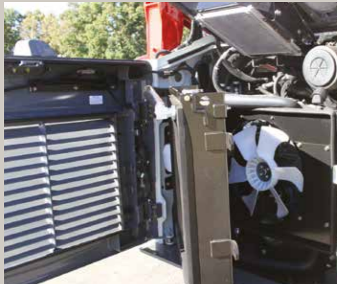
Facilité d'accès pour la maintenance