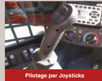
Pilotage par Joysticks