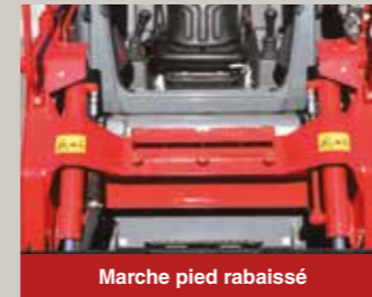
Marche pied rabaisé