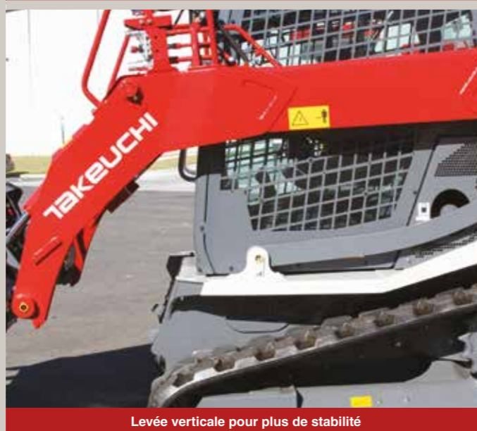
Levée verticale pour plus de stabilité