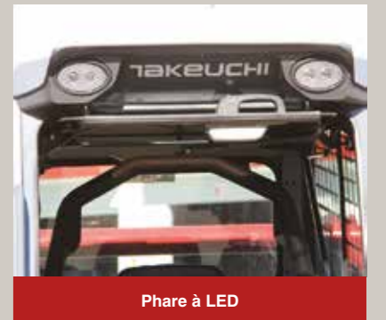
Phare à LED