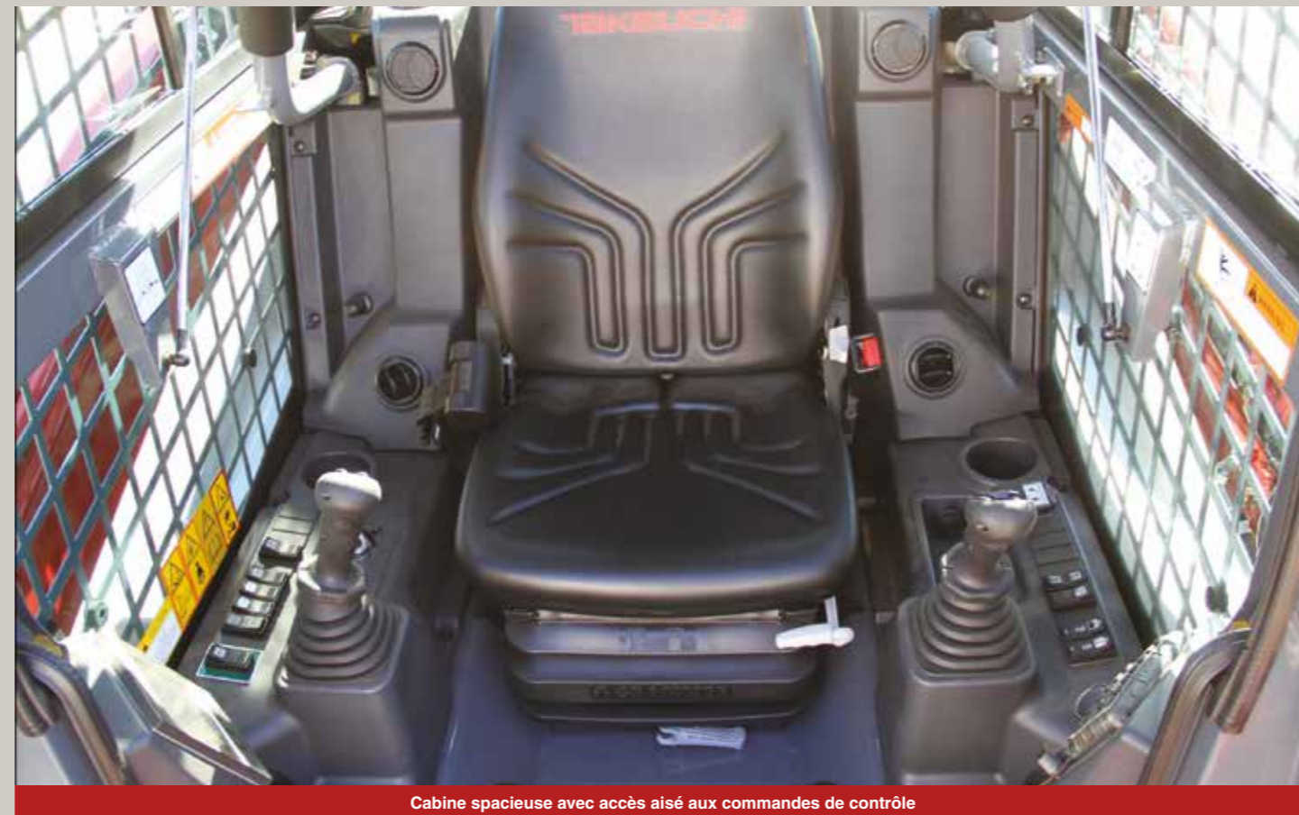
Cabine spacieuse avec accès aisé aux commandes de contrôle

Le TL10V-2 dispose d'un puissant moteur de 74,3 cv conforme aux normes européennes incluant les dernières directives européennes Tier4 sur les émissions standards tout en lui permettant d'apporter une puissance exceptionnelle de couple pour la meilleure performance dans les applications les plus exigeantes.