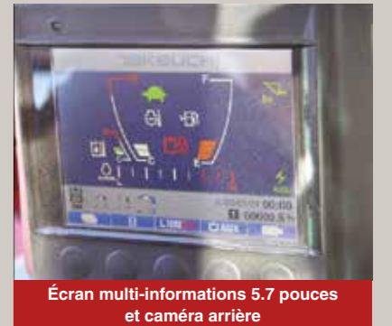
Écran multi-informations 5.7 pouces et caméra arrière